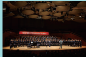
広東実験中学校合唱団 中国