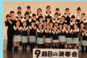
池田ジュニア合唱団 大阪府