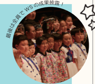
最後は全員でWSの成果披露!